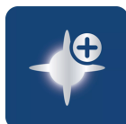
До 5000 Кельвинов 1), 2)

Кристалльно-белый свет с эффектом светодиодного освещения – для стильного облика автомобиля